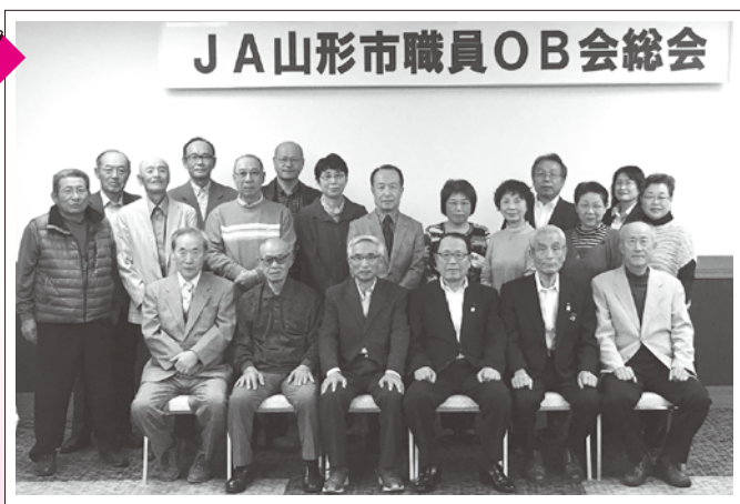
JA山形市職員OB会総会

また、懇親会は、お互いの近況や現役時の思い出など尽きる事のない話にあって言う間に時が過ぎ、来年の再会を約束し終宴となりました。