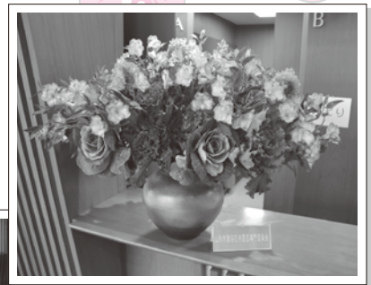
▲花卉園芸専門委員会の花で会場を飾りました。

前日の24日(土)は、青少年育成事業として「第九」のリハーサルを県内の親子連れ約350人に公開。この事業は平成17年から行っており、今年で18回目となります。今後も青少年育成事業を継続的に支援していききたいと思います。