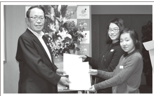
▲平成29年1月6日役員室にて

11月に行った修学旅行先でのつや姫PRで「つや姫」を提供した御礼として6年1組、2組から感謝の手紙をいただきました。 昨年度5年生だった頃の稲刈りから修学旅行でのつや姫PRまでの感想やこれからつや姫を食べたい等、嬉しい言葉をいただきました。