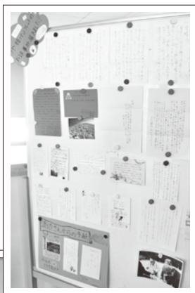
▼第二小へ届いたお礼の手紙