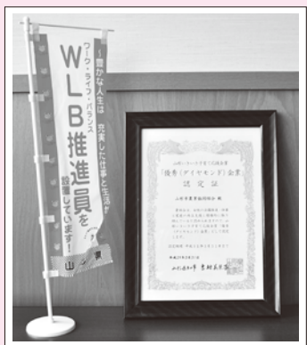
山形いきいき子育て応援事業 「優秀(ダイヤモンド)企業」認定

この認定証は、女性の活躍推進・仕事と家庭の両立支援に積極的に取り組んでいる企業・団体に交付されるものです。