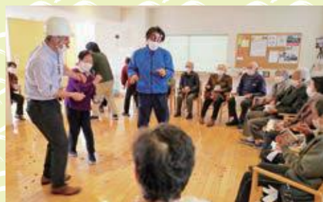
入居者同士でにぎやかに豆まきを行いました。