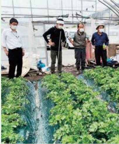
4月26日(火) 春作セルリー圃場巡回