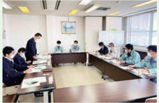
4月6日(水) JA えちご上越セルリー団地視察