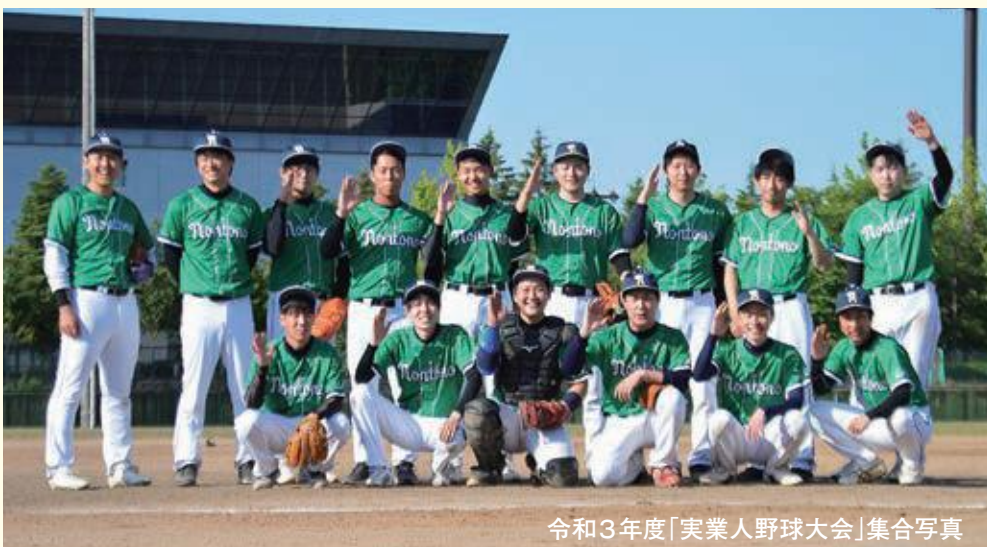
令和3年度「実業人野球大会」集合写真