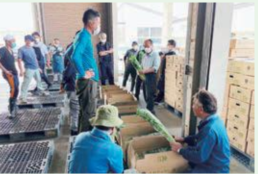
5月6日(金) ひめセルリー初出荷・ひめセルリー目揃い会