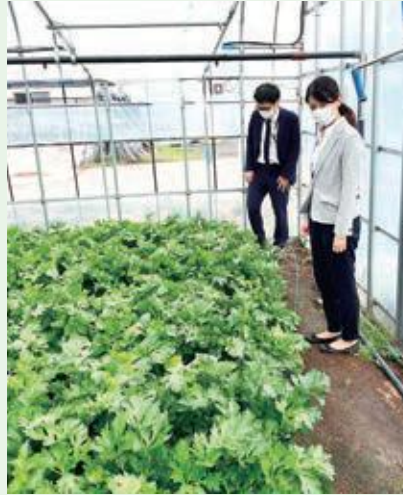
4月27日(水) 全農青果センター(株)による視察・出荷打合せ