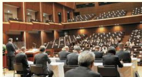
第73回通常総会の様子