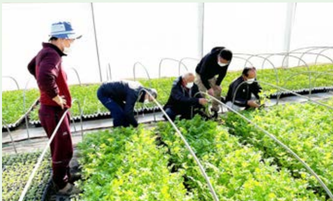
令和5年2月28日(火) セルリー育苗巡回