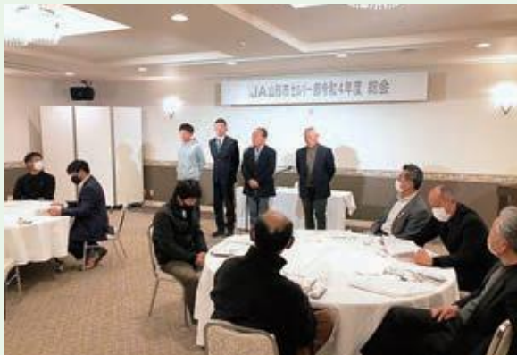
令和5年2月14日(火) 令和4年度セルリー一部総会