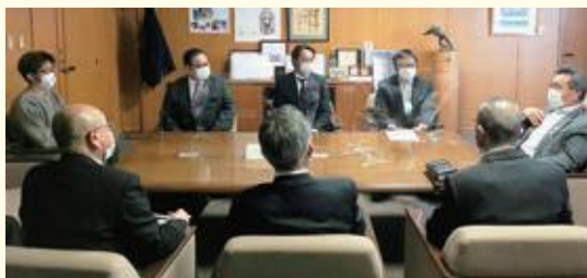
3月6日(月)新4役が組合長へあいさつに来訪しました。