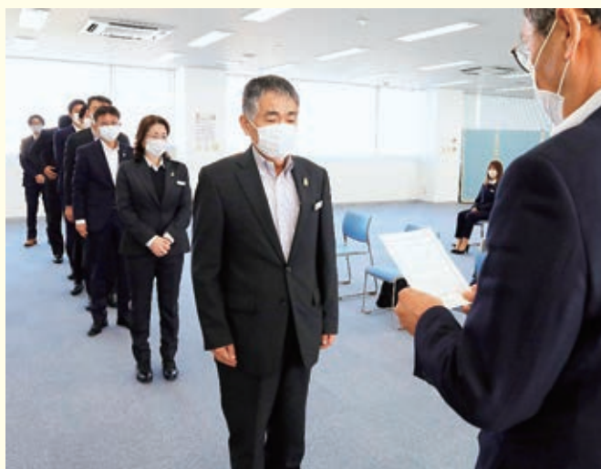
4月1日(土)、本店で発令が行われました。