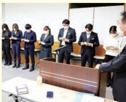
練習を積んだ札勘の披露

3月9日(木)、本店3階にて今年度最後の喜望塾があり令和4年度の喜望塾が終了しました。