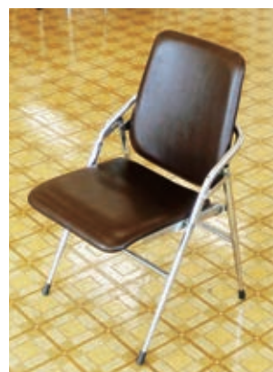
折りたたんで保管できるパイプ椅子です。