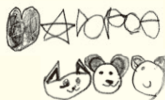
日依莉さんのイラスト

JAさんへ。 としょけんありがとうございます。 えんぴつやけしごむやノートやぼんをかっていっぱいおべんきょうをします。