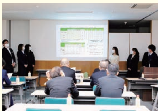
グループディスカッションを重ねながら喜望塾生全員で作成したATMパンフレットの説明