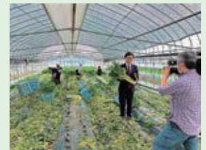
5月24日(水) NHK「やままる」にて放送