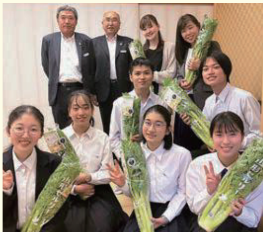
御礼に山形セルリーを贈呈しました