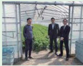
5月10日(水) 東京日比谷レストランによる視察