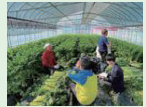
5月11日(木) YTS「ゴジダス」にて放送