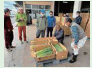
5月8日(月) ひめセルリー目揃会