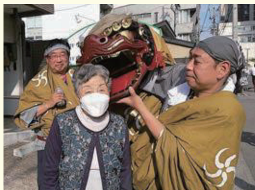
獅子舞にご利益をいただく入居者