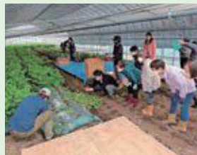
5月15日(月) 寒河江生協による収穫体験