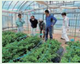
5月2日(火) 園芸試験場へ視察(4名)