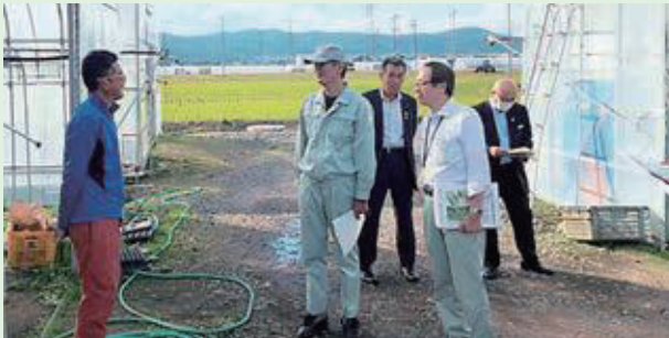
10月25日(水) 山形県村山総合支庁長・産業経済部長・産業経済部次長 ほか2名