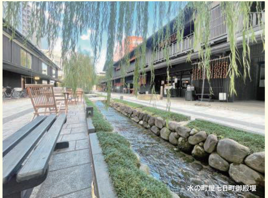
水の町屋七日町御殿堰

※鳥居忠政(1566年ー1628年) NHK大河ドラマ「どうする家康」伏見城の戦いに登場する鳥居元忠の息子。関ヶ原の戦いの前哨戦、伏見城の戦いの際に父・元忠が戦死し、遺領の下総矢作(千葉県)4万石を継ぐ。磐城(いわき)平藩(福島県)を経て、元和8年出羽(でわ)山形藩主鳥居家初代。24万石。東国の軍事的抑えの役をつとめた。