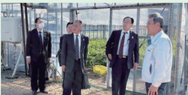
11月1日(水) 山形税務署長 セルリー団地視察