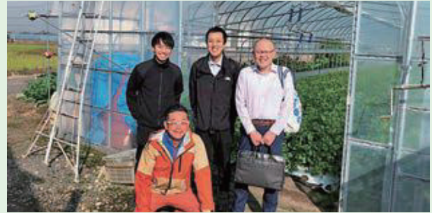
10月24日(火) 山形セルリー販売打ち合わせ コーベデリ連合会・JA全農青果センター(株)