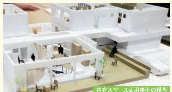
共有スペース活用事例の模型

喜望塾生、不動産部の職員で芸工大より間取りや共有スペースの活用方法について第3回目のプレゼンテーションを受け、ワークショップで意見交換を行いました。