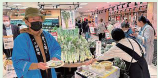
11月4日(土) 仙台三越・S-PAL 山形セルリー販売促進 生産者