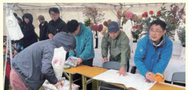
山形市花き連絡協議会運営の「山形市フラワーフェスティバル」