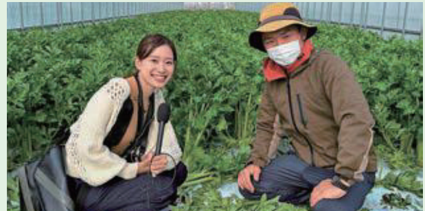
10月27日(金) NHK ラジオ「なにになったのや〜?」生中継