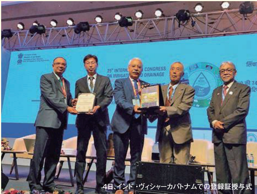
4日、インド・ヴィンジャーカパトナムでの登録証授与式

この制度は、かんがい農業の発展に貢献した技術により建設され100年以上経過したものなど、歴史的・技術的・社会的価値のあるかんがい施設を登録・表彰するために「国際かんがい排水委員会(ICID)」より創設された制度です。