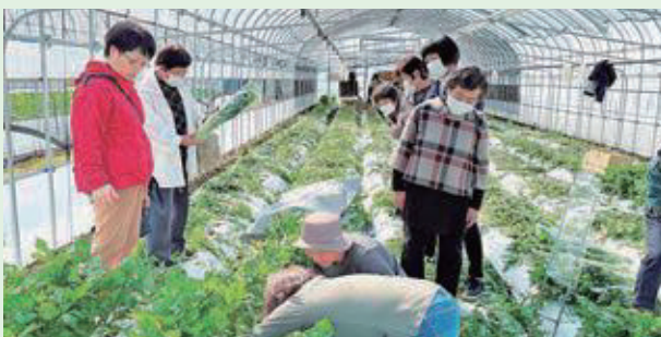
10月29日(日) 東根生協山形セルリー収穫体験(令和5年度食農体験推進事業)