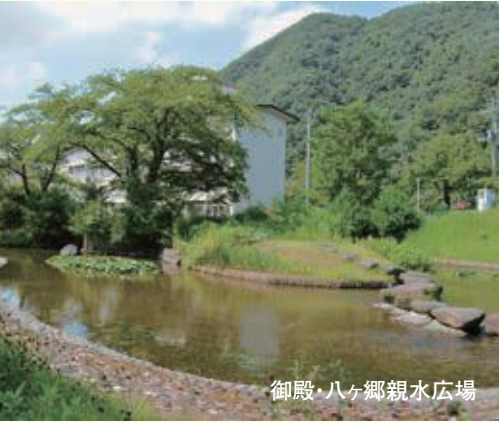
御殿・八ヶ郷親水広場

「山形五堰」は御殿堰・宮町堰・笹堰・八ヶ郷堰・双月堰の総称で、馬見ヶ崎川から一括取水され、西に向かつて枝分かれを繰り返しながら全長11.5kmの堰が市街地の中を網目のように流れています。市街地を流下する堰は全国でも珍しく、山形市の景観の特徴となり歴史的財産として受け継がれています。 当農協の農家組合員が中心となり、五堰のうち御殿堰・宮町堰・笹堰を長年管理してきました。