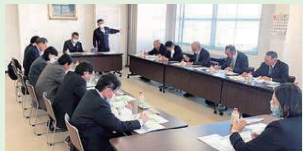
10月31日(火) 岩手県都市農業委員会会長会優良先進地視察