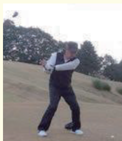
大山組合長による始球式