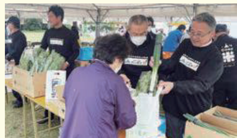
当農協の販売ブース