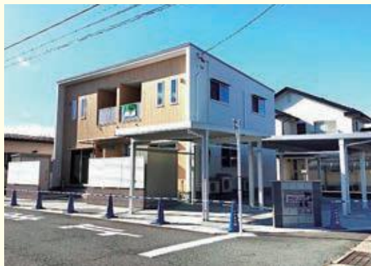
ハウス上町 [上町3丁目] 部屋のタイプ 2LDK×2世帯