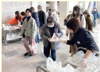
おにぎりセットを受け取る来場客

記念すべき第10回を迎えた今回は、当農協と山形農協の共同協賛により「赤飯」の紅と「つや姫」の白の紅白のおにぎりセットを両日ともに先着100名に提供しました。開場からわずか数分程度で全て配布され、大盛況となりました。