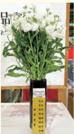
結城 慎治さん(上町3) カルテットホワイト