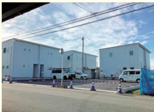
ハウス桧町 [桧町4丁目] 部屋のタイプ 2LDK×2世帯 3LDK×4世帯