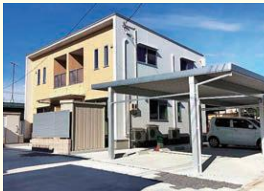
ハウス籠田 [籠田1丁目] 部屋のタイプ 2LDK×2世帯