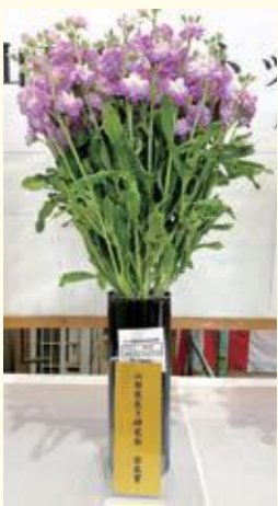
佐々木 博さん(片平) カルテットピンクフラッシュ