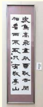
木村英子さんの作品 (雅号 木村英翔)