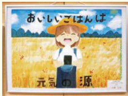
最優秀賞作品「おいしいごはんは元気の源」

このコンクールは米を中心とした日本型食生活の良さを見直し、農業への理解とお米の消費拡大を図るため、ごはんを食べたくなるような標語入りのポスターをテーマに毎年開催されています。村山地域内の小学校81校・応募総数1,916点の中から見事最優秀賞に輝きました。受賞した作品は村山地域の市役所や役場、図書館などの公共機関で巡回展示されます。