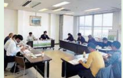
11月13日(水) JA豊橋(愛知県)洋菜部会視察研修