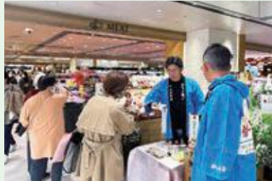
11月12日(火) 山形セルリー販売促進活動 仙台エスパル・仙台三越