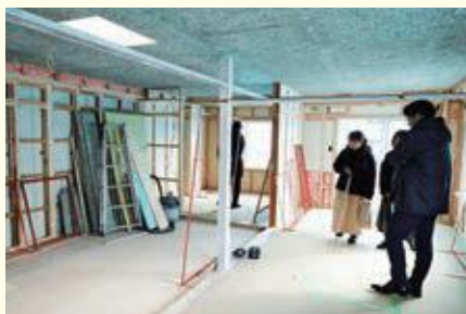
11月19日(火)の内装状況