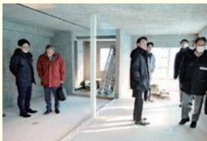
12月3日(火)の内装状況