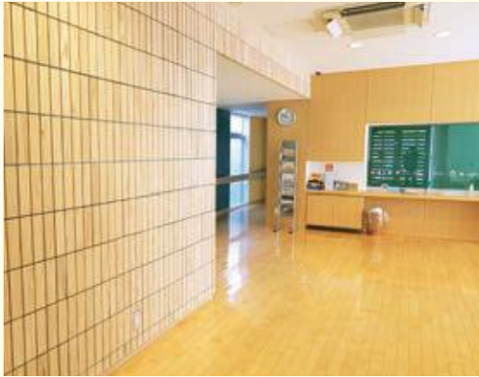
木質化が完了したロビー