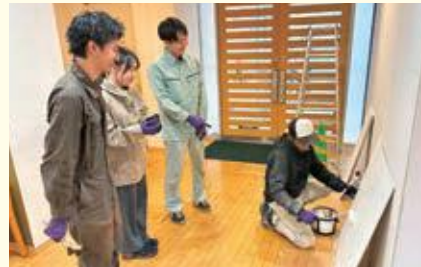
プロに指導をいただきながら行った芸工大建築環境デザイン学科の学生3名による 塗装作業・市産材の貼り付け作業