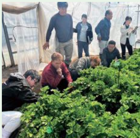
4月30日(水) 園芸農業研究所(寒河江市)の実験圃場視察

4月14日(月)、昨年、秋作の残留農薬問題を受けて、安全・安心なセルリーを出荷するために、GI登録に基づく出荷管理・流通管理等を強化し、ブランド化をより進めることを協議し、令和7年度春作出荷より農協出荷へ一本化することを決定しました。※今年度、出荷前全圃場残留農薬検査を実施して安全・安心な山形セルリーを届けてまいります。