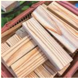
木目が美しい市産材