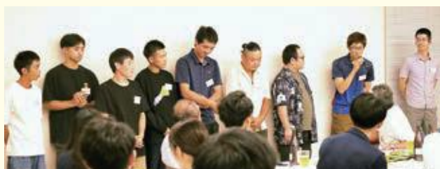
青年部のみなさんによる自己紹介