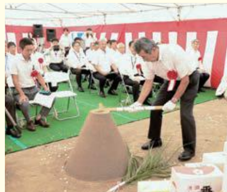
鉄入の儀を行う大山組合長