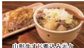
山形牛すじ煮込み㊦と 山形牛タタキ㊦