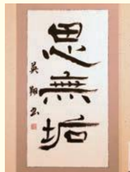
木村英子さんの作品 (雅号 木村英翔)