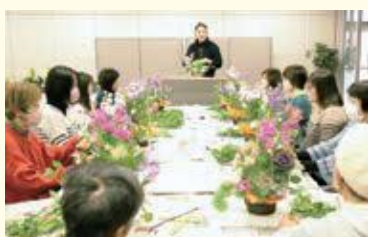
フラワーアレンジメント教室