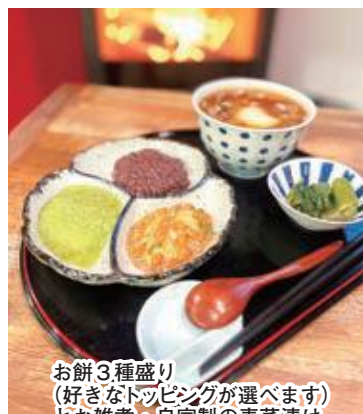
お餅3種盛り (好きなトッピングが選べます) とお雑煮・自家製の青菜漬