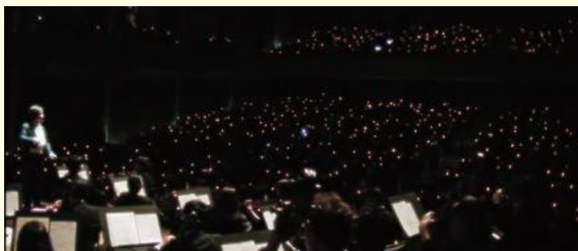
キャンドルライトを灯した会場