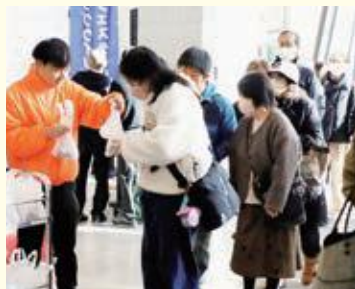
瞬間におにぎりのプレゼントは終了 しました

当農協と山形農協の協賛に より「つや姫」のおにぎりが両 日ともに200個提供されま した。