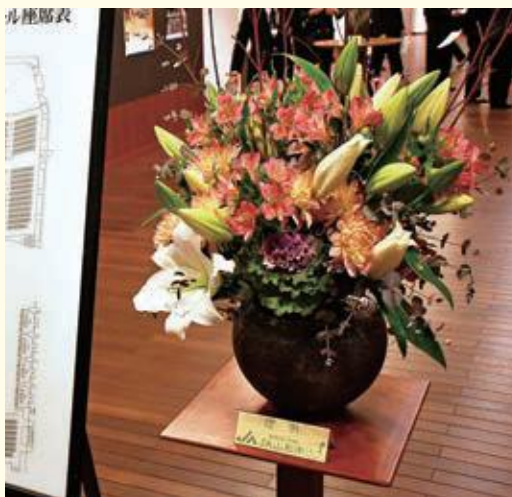
毎年、花卉園芸専門委員会より飾花の提供を行っています。