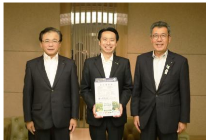
山形市へ窓口用封筒提供