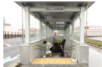
山形駅南アンダーの清掃活動