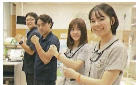
認知症サポーター