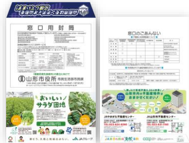
市役所窓口用封筒