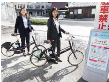
山形市コミュニティサイクルの設置