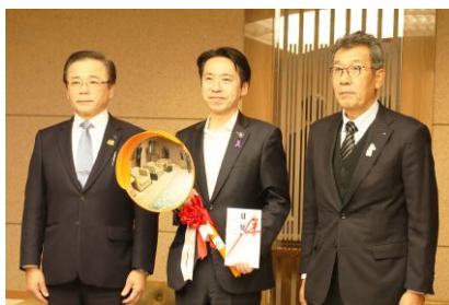
カーブミラー贈呈式