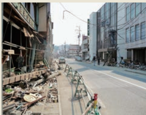
平成23年4月11日 宮城県気仙沼市の様子