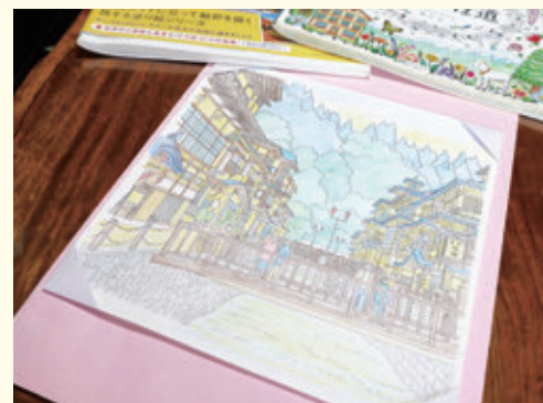
▲力作の塗り絵 銀山温泉