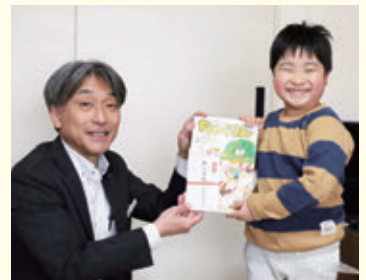
お祝いを受け取る実岬さん㊟と大場支店長㊟

当農協では平成5年から助成を始め、今年は18名を受入れし、これまで703名の児童をお祝いしております。