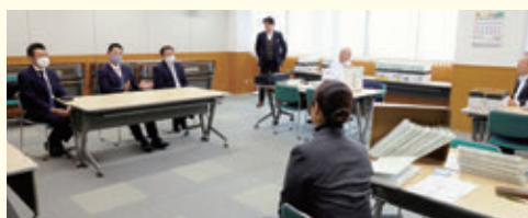
3月4日、山形税務署長が現場挨拶に来店しました。

令和7年度の確定申告業務について、3月4日(水)に行われた派遣税理士による記帳代行利用者の確定申告書点検日にあわせ、各本支店の334件分を送信しました。また、記帳代行利用者分244件を送信、13日(金)に書面提出分を山形税務署へ提出し今年度の確定申告業務は終了しております。