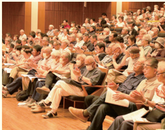
第77回 通常総会 正組合員席

※ 3/31現在の正組合員数 1,133名 (台帳登録者※相続が発生し、確定していない場合は人数に含んでおりません。) ※ 過半数 567名…委任状出席も含む