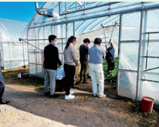
4月13日(月) JA 群馬佐波伊勢崎セルリー団地視察研修