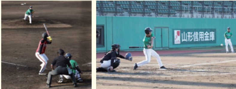
第60回山形実業人野球大会の様子

農協親睦会「のんきな殿さま野球部」は、山形新聞らの主催による企業間野球大会「第61回山形実業人野球大会」に今年も参加します。 一回戦は5月19日（火）朝5時30分よりきらやかスタジアムで行われます。 是非応援の程宜しくお願い申し上げます。