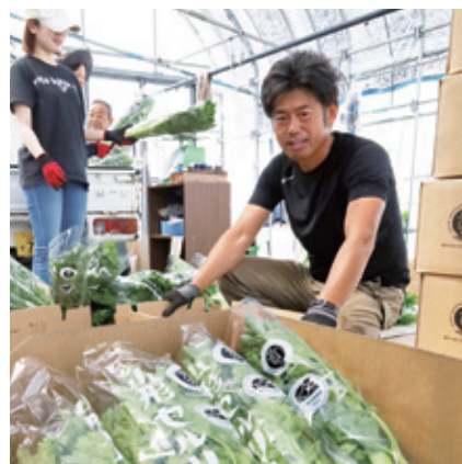
5月20日(水) 山形セルリー出荷風景