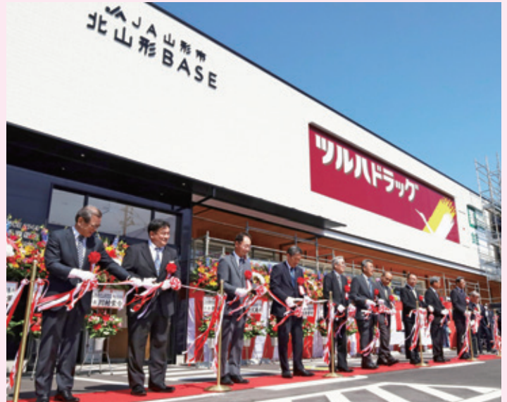
竣工式 テープカットの様子