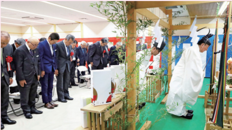
竣工祭による神事