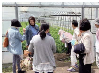
6月5日(金) 消費者連合セルリー団地視察(5名)