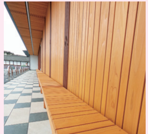
山形市産材を利用した木製ベンチ