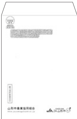
お届けしている封筒

6月18日(木)の一斉外務において、組合員のみなさまに出資金の「配当金計算書」をお届けしています。この書類は翌年3月の確定申告(税務申告)に必要な書類となります。大切に保管いただきますようお願い申し上げます。