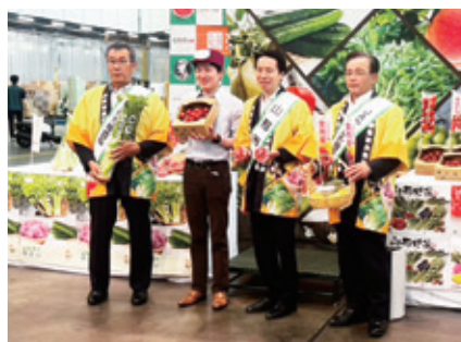
5月28日(木) 山形市消費宣伝トップセールス(東京)