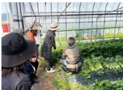
5月11日(月) 天童生協による収穫体験