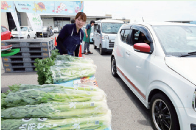
車が並び賑わいました